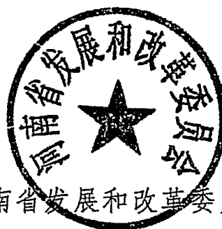
河南省发展和改革委员会