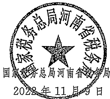
国家税务总局河南省税务局